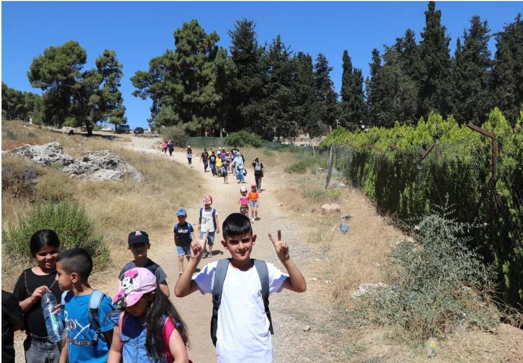
On a fieldtrip

De Bethlehem-zomerworkshops voor ongeveer 100 kinderen, vrouwen en jongvolwassenen draaiden om twee kernthema's: "De integrale ecologische benadering", geïnspireerd door de encycliek "Gemeenschappelijk Huis" van paus Franciscus, en een citaat van de Palestijnse dichter Mahmud Darwish: "Op dit land is er iets dat het waard is om voor te leven." De geest van teamwork was voelbaar in de verhalen, artistieke creaties en milieu-liedjes die zowel door studenten als vrouwelijke deelnemers werden getoond of voorgedragen.