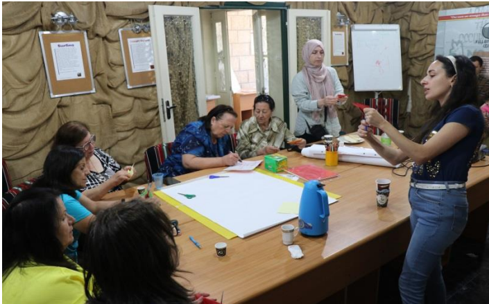
Op het Sumud Story House